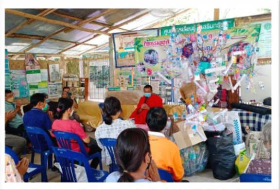
โครงการบริหารจัดการขยะ