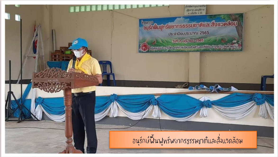
อนุรักษ์ฟื้นฟูทรัพยากรธรรมชาติและสิ่งแวดล้อม