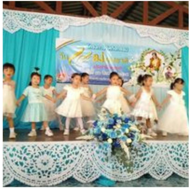
ส่งเสริมกิจกรรมวันแม่แห่งชาติ