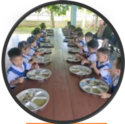
โครงการอาหารกลางวันเด็ก