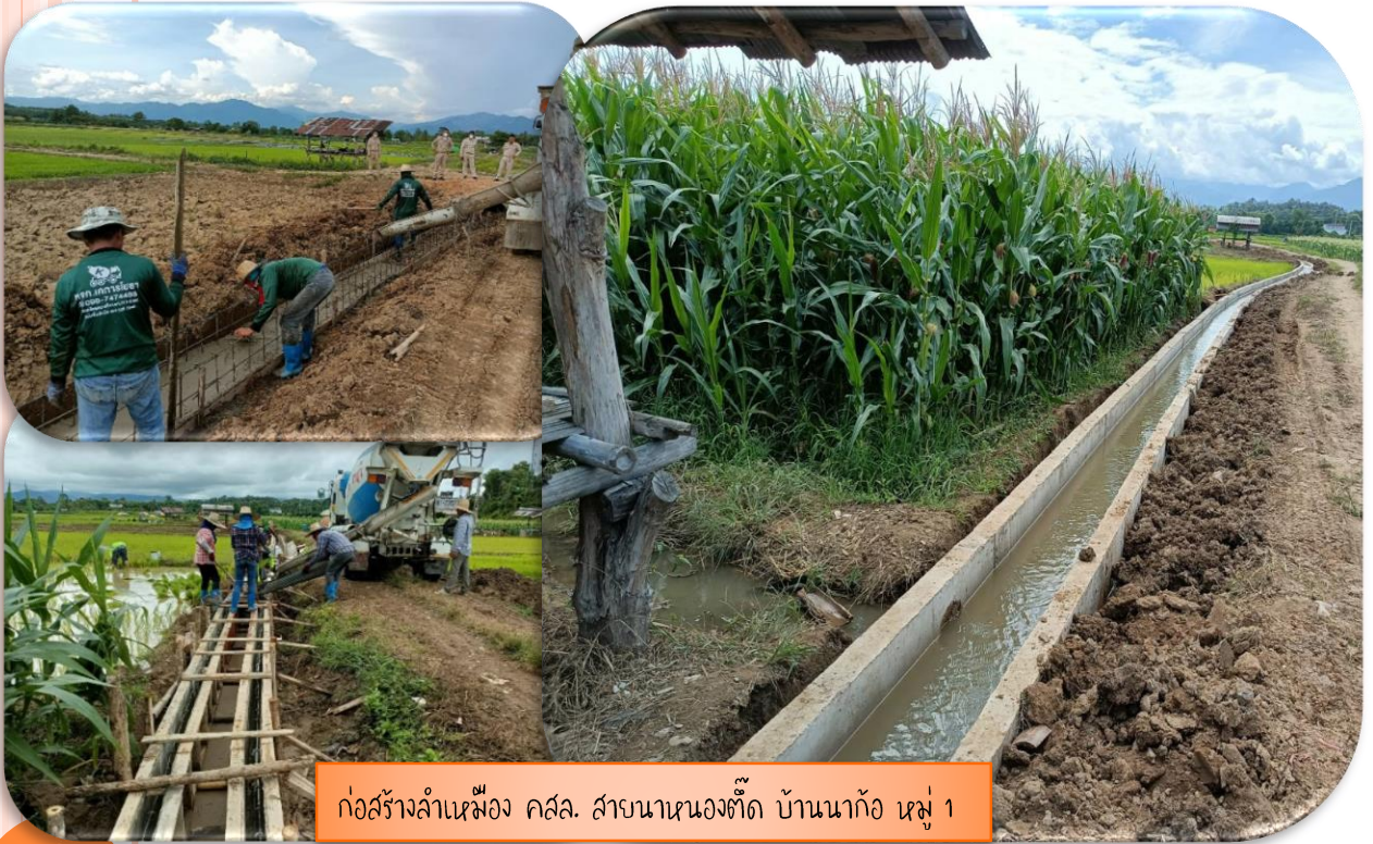
ก่อสร้างลำเหมือง คสล. สาขานาหนองตืด บ้านนาแก้ว หมู่ 1