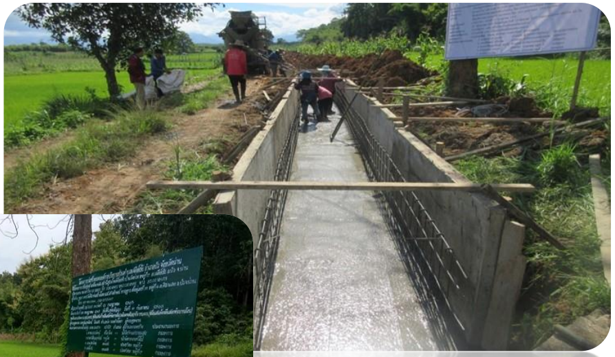
ปรับปรุงลำเหมือง คสล. สถานีสูบน้ำพลังไฟฟ้าบ้านวังม่วง หมู่ 7