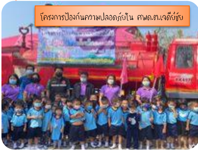
โครงการป้องกันความปลอดภัยใน ศพด.ต.เจดีย์ชัย