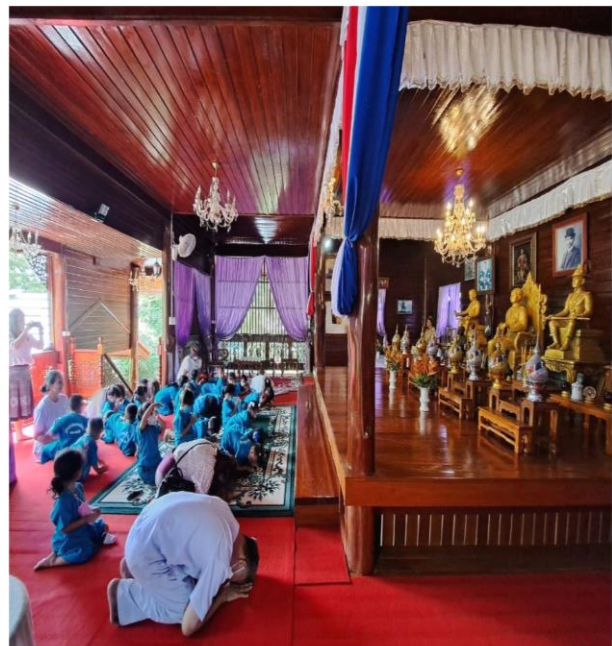
โครงการเด็กดี วิถีพุทธ