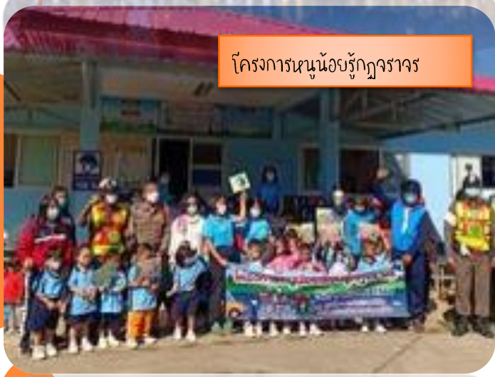
โครงการหนูน้อยรูกฎจราจร