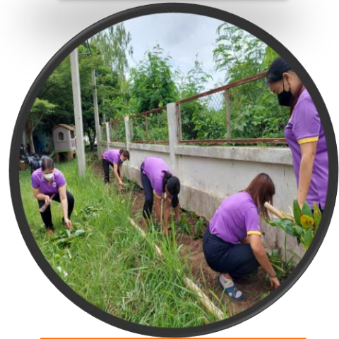
โครงการปลูกผักสวนครัวรั้วกินได้