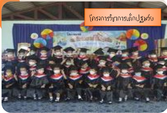
โครงการวิชาการเด็กปฐมวัย